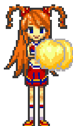
右の場合の「前フリ」ポーズ