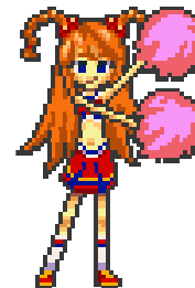
どのキーを押すか素早く判断